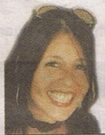
VON ANDREA LANG

Solche Träume können geschmiedet werden. Als Maßanfertigung! In einer Goldschmiede gibt es keine Schmuck-Kollektionen in sämtlichen Farben. Nur einen Safe mit Edelsteinen. Kreativität ist gefragt.